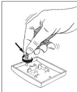
Montering av impulsfjäder.